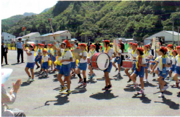
昭和小学校様 交通安全鼓笛隊パレード↑